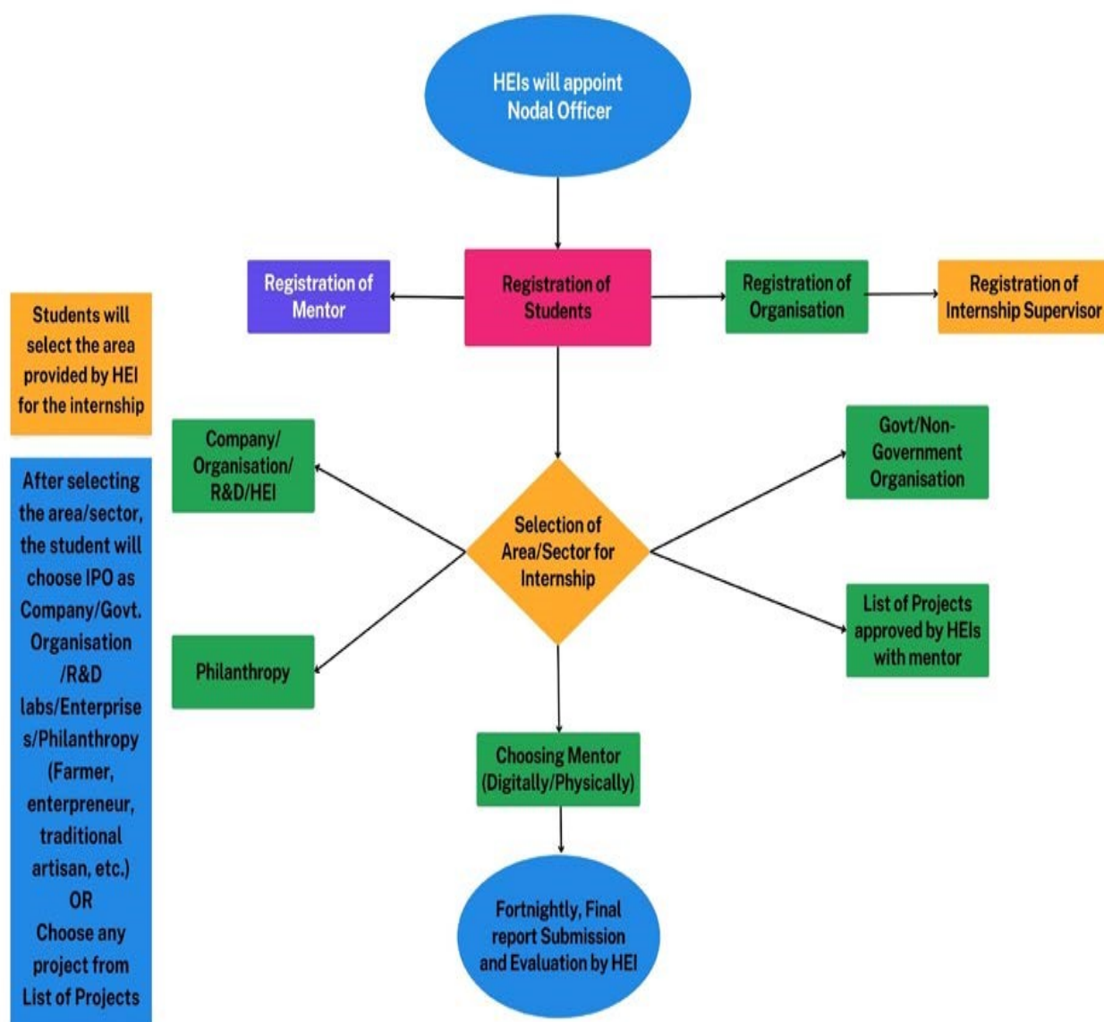
Figure 1: Operational Structure of Internship

HEIs should develop a roadmap for the smooth functioning of the internship programme through